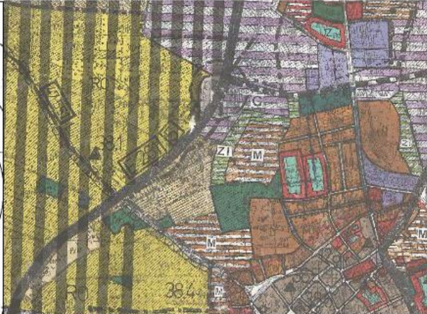
WYRYS ZE "STUDIUM UWARUNKOWAŃ I KIERUNKÓW ZAGOSPODAROWANIA PRZESTRZENNEGO GMINY TRZEBNICA" UCHWALONEGO UCHWAŁĄ RADY MIASTA I GMINY W TRZEBNICY NR XVIII/195/2000 Z DNIA 29 CZERWCA 2000 R. SKALA 1:10 000

STAROSTA TRZEBNICY Powiatowy Czynnik Dokumentacji Geodezyjnej i Kartograficznej Podpisuję niniejszą mapę z zachowaniem przepisów o zadaniach urzędu geodezyjnego i kartograficznego w dniu: 21.05.2009 Miejscowość: Trzebnica Adres: ul. Piłsudskiego 10, Trzebnica