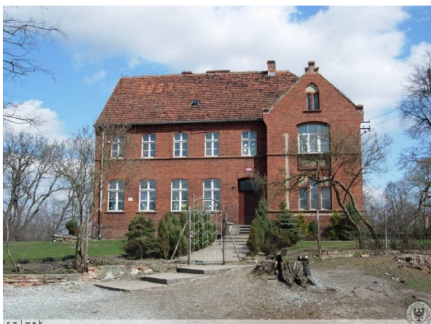
Rysunek 3 Szkoła Podstawowa w Masłowie