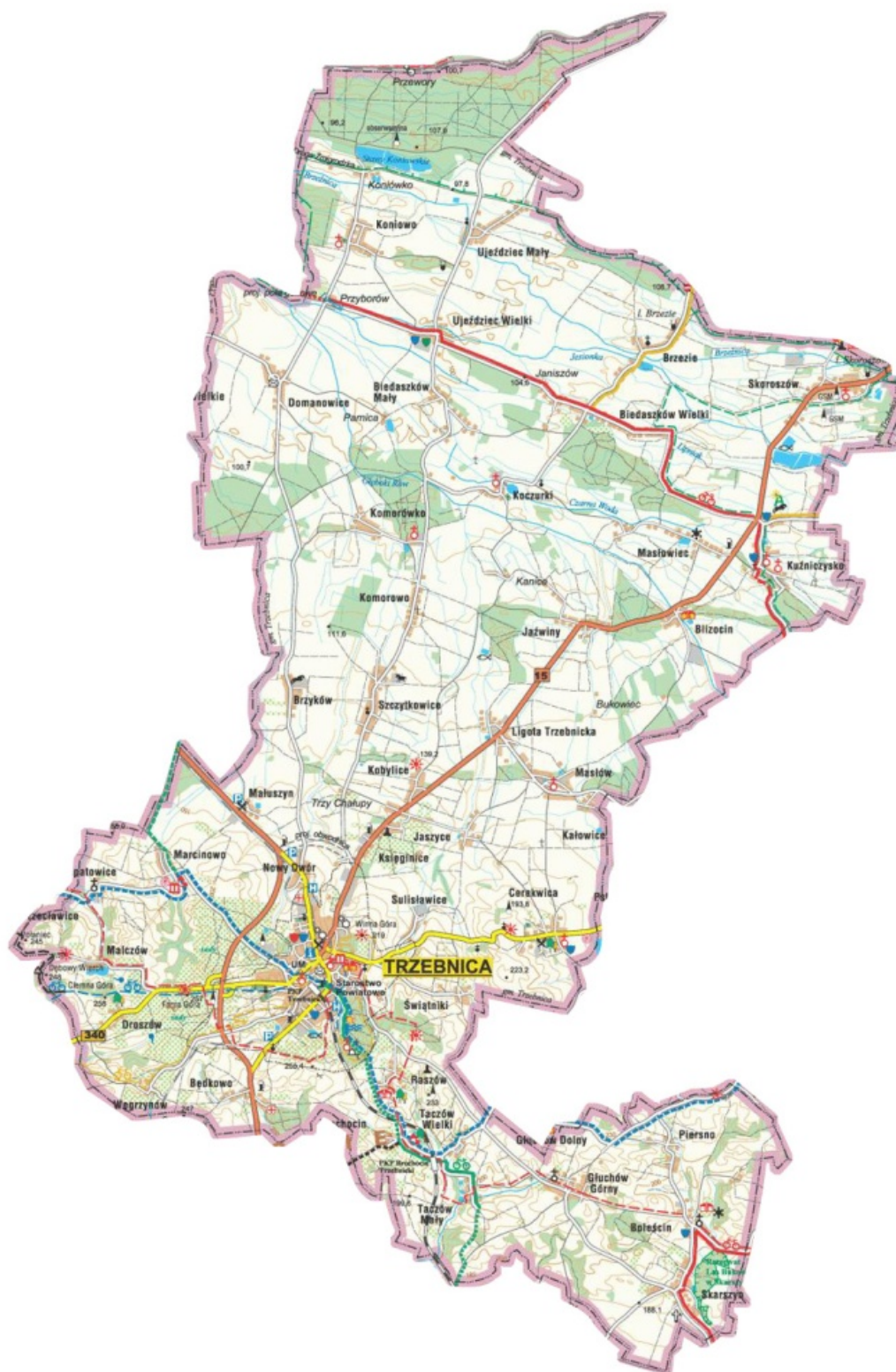
Rysunek 1. Mapa Gminy Trzebnica