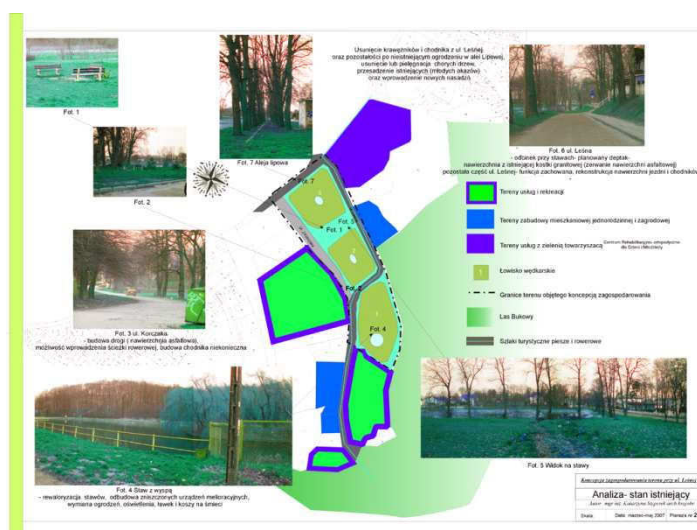
Rysunek 3. Tereny zielone przy ulicy Leśnej i Korczaka. Mapa sytuacyjna ukazuje lokalizację tych terenów.

Obszar rewitalizowany obejmuje również tereny zielone wraz ze stawami przy ulicach Leśnej i Korczaka. Projekt rewitalizacji przewiduje uczynienie z tego obszaru estetycznego miejsca spacerów i wypoczynku poprzez działania inwestycyjne w zakresie zmiany organizacji ruchu, porządkowania i organizacji przestrzeni (mała architektura: ławki, oświetlenia, pojemniki na śmieci, pomost, pawilon parkowy).