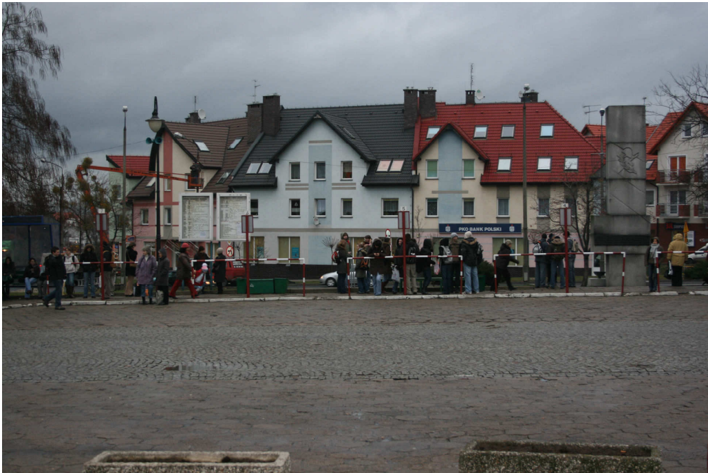
Fot. 6. Plac Piłsudskiego. Widoczna zniszczona nawierzchnia płyty dworca.

Plan rewitalizacji placu Piłsudskiego zakłada likwidację dworca i utworzenie w tym miejscu parkingu oraz uczynienia z niego miejsca reprezentacyjnego i wizytówki miasta.