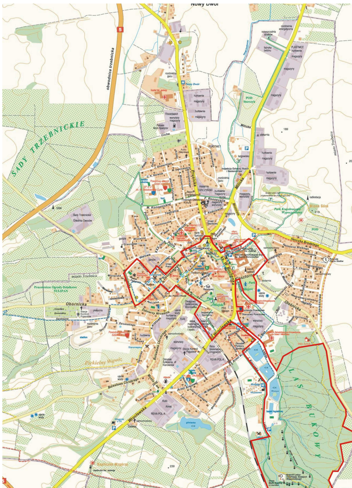
Rysunek 1. Obszar rewitalizowany na tle całego miasta.