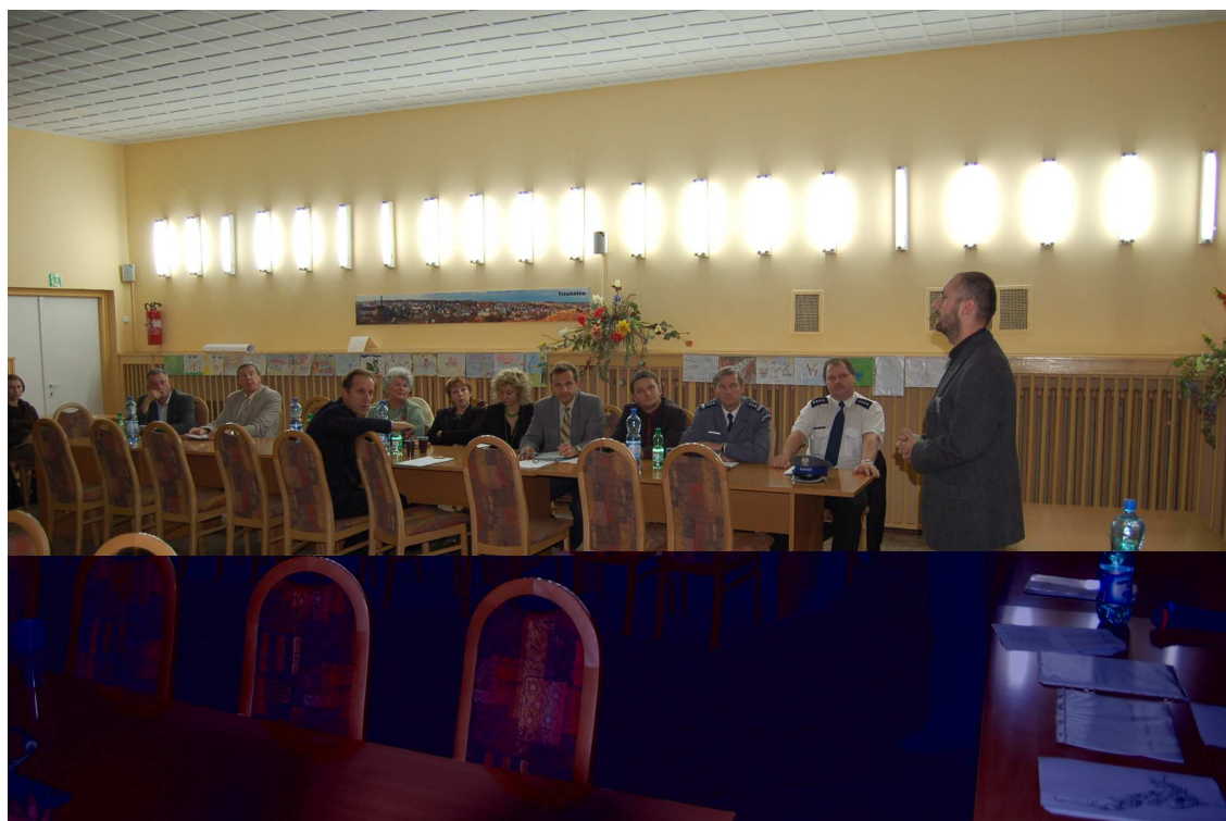
Fot. 1. Zespół opracowujący Lokalny Program Rewitalizacji prezentuje założenia i metodologię sporządzania dokumentu.

zostały wygenerowane, przedyskutowane, a następnie ostatecznie sformułowane cele rewitalizacji oraz zapoznano uczestników z wnioskiem inwestycyjnym. Po zapoznaniu się z logiką rewitalizacji oraz możliwościami pozyskania dofinansowania na ten cel ze środków zewnętrznych uczestnicy warsztatów zaproponowali listę kilkunastu potencjalnych celów rewitalizacji. Następnie cele te zostały skonsolidowane w trzy cele ogólne, w których zawierały się poszczególne cele szczegółowe. Udział w warsztatach wzięli przedstawiciele władz miasta, pracownicy Urzędu Miejskiego i jego jednostek organizacyjnych oraz liderzy lokalni i przedstawiciele organizacji społecznych działających na terenie miasta. W spotkaniach (warsztatach) organizowanych w ramach konsultacji wzięło udział ok. 40 osób.