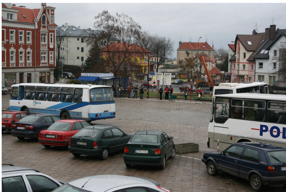
Fot. 5. Plac Piłsudskiego przed budynkiem Urzędu Miejskiego.

Wzmożony ruch drogowy przyczynił się również do uszkodzeń nawierzchni. Widoczne jest to zwłaszcza na Placu Piłsudskiego (dworzec PKS przed budynkiem Urzędu Miejskiego) co obrazują poniższe fotografie.