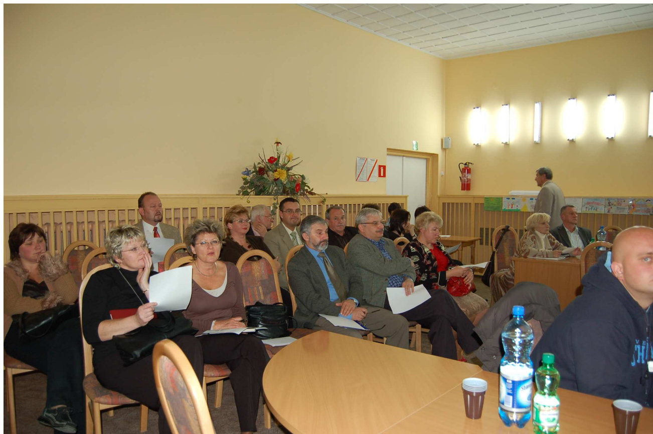
Fot. 2. Uczestnicy warsztatu poświęconego opracowaniu Lokalnego Programu Rewitalizacji.

na stronach internetowych Urzędu Miejskiego, przez potencjalnych beneficjentów programu. Tym samym zespół opracowujący dokument mógł uwzględnić preferencje lokalnej społeczności w zakresie rodzaju działań realizowanych w ramach LPR. Wypełnione wnioski inwestycyjne złożyły następujące podmioty: Komenda Wojewódzka Policji we Wrocławiu, Towarzystwo Boskiego Zbawiciela- Dom Zakonny w Trzebnicy, Gmina Trzebnica, Zakład Gospodarki Mieszkaniowej w Trzebnicy oraz zarządcy wspólnot mieszkaniowych z obszaru rewitalizowanego. Propozycje te zostały w większości uwzględnione w Lokalnym Programie Rewitalizacji Miasta Trzebnica a zadania przedstawione przez beneficjentów wpisane do dokumentu.