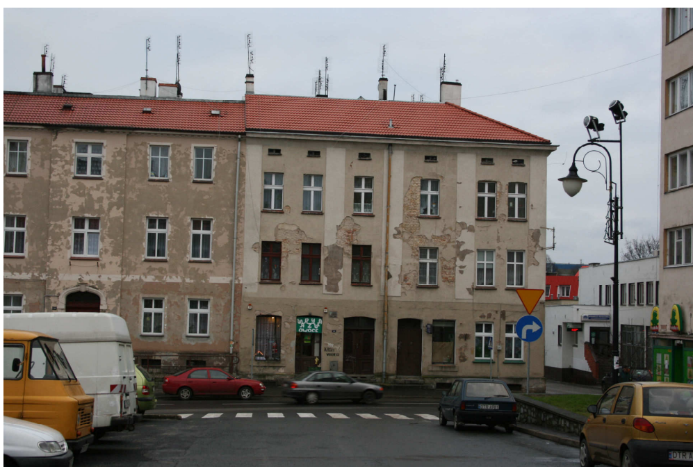
Fot. 3. Rynek w Trzebnicy

Zabudowa mieszkaniowa na obszarze rewitalizowanym to w większości kamienice budowane na przełomie XIX i XX wieku. Elewacje kamienic są w złym stanie technicznym, obniżają estetykę centrum i wymagają pilnych remontów. Typowe zniszczenia elewacji budynków prezentują poniższe zdjęcia (fot. 3 i 4). Projekty zmierzające do odnowienia kamienic mają zmienić stan obecny.