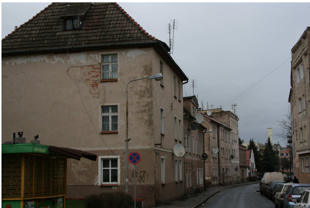
Fot. 4. Ulica Głowackiego w Trzebnicy.

Wzmożony ruch drogowy przyczynił się również do uszkodzeń nawierzchni. Widoczne jest to zwłaszcza na Placu Piłsudskiego (dworzec PKS przed budynkiem Urzędu Miejskiego) co obrazują poniższe fotografie.