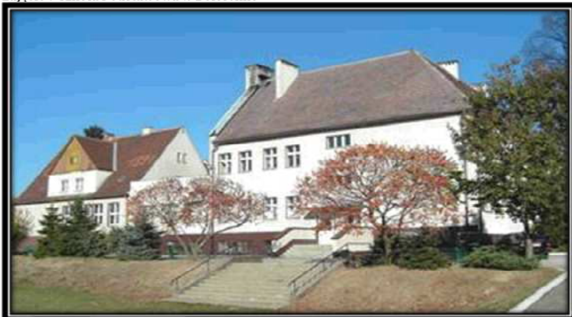
Zdjęcie 7 Szkoła Podstawowa w Boleścinie

W miejscowości Boleścin funkcjonuje Szkoła Podstawowa, do której uczęszczają dzieci z Boleścina.