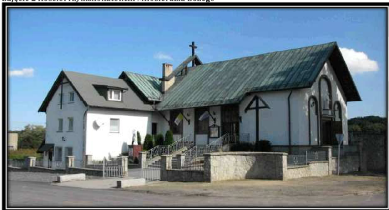
Zdjęcie 2 Kościół rzymskokatolicki Miłosierdzia Bożego