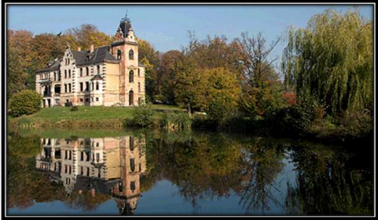
Zdjęcie 6 Pałac w Bolescinie

W miejscowości Bolescin znajduje się pałac z końca XIX wieku i początku XX wieku z parkiem z XVIII/XIX wieku.