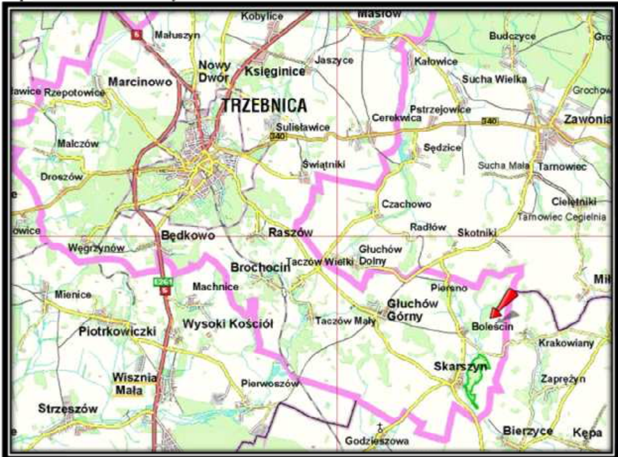
Mapa 1 Bolescin na tle Gminy Trzebnica

Sołectwo Bolescin jest miejscowością położoną w Gminie Trzebnica, w Powiecie Trzebnickim w województwie dolnośląskim. Bolescin leży w południowo-wschodniej części Gminy Trzebnica, ok. 20 km na północ od Wrocławia.