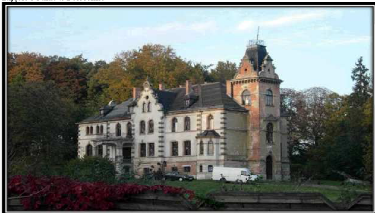
Zdjęcie 3 Pałac w Bolescinie