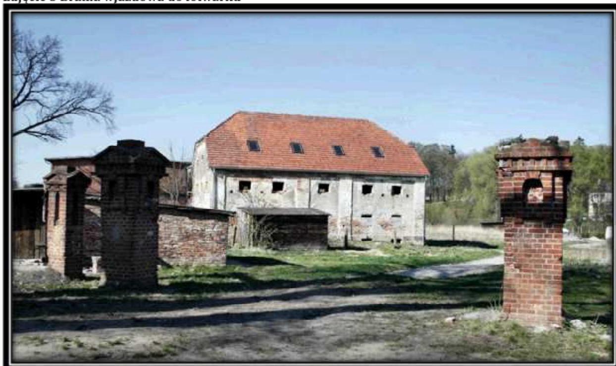
Zdjęcie 5 Brama wjazdowa do folwarku