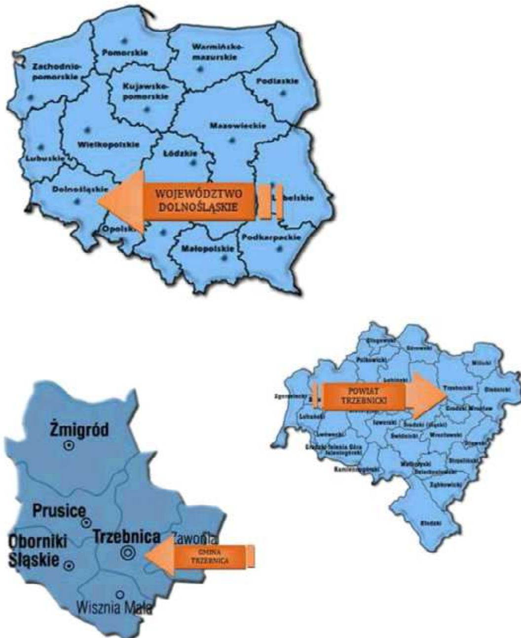
Mapa 3 Lokalizacja Gminy Trzebnica na tle Polski, województwa i powiatu

Bolescin jest sołectwem i stanowi jednostkę pomocniczą Gminy Trzebnica. Gmina ta jest jedną z sześciu gmin Powiatu Trzebnickiego. Powiat Trzebnicki położony jest w województwie dolnośląskim.