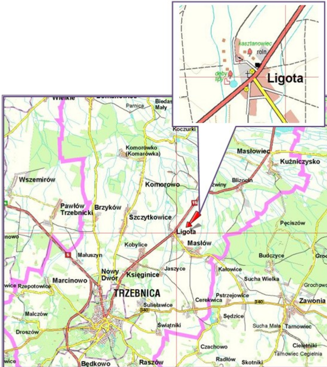
Mapa 2 Lokalizacja Sołectwa Ligota na tle Gminy Trzebnica (zaznaczone czerwoną strzałką)

W ujęciu międzynarodowym Trzebnica leży blisko ważnych partnerów zagranicznych naszego kraju - Niemiec i Czech, a także rozpoznawana jest w kraju i na świecie poprzez wspomniane wyżej Międzynarodowe Sanktuarium św. Jadwigi Śląskiej.