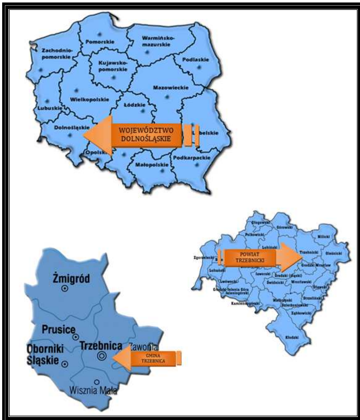
Mapa 4 Lokalizacja Gminy Trzebnica na tle Polski, województwa i powiatu

Raszów jest sołectwem i stanowi jednostkę pomocniczą Gminy Trzebnica. Gmina ta jest jedną z sześciu gmin Powiatu Trzebnickiego. Powiat Trzebnicki położony jest w województwie dolnośląskim.