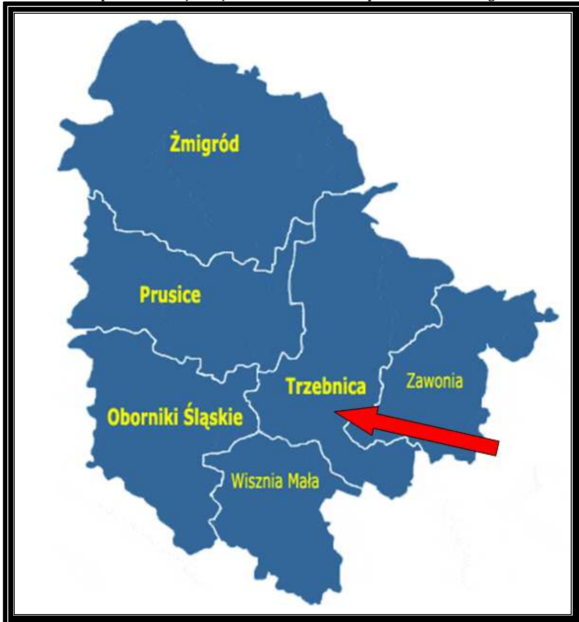
Mapa 2 Lokalizacja miejscowości Raszków na tle powiatu trzebnickiego