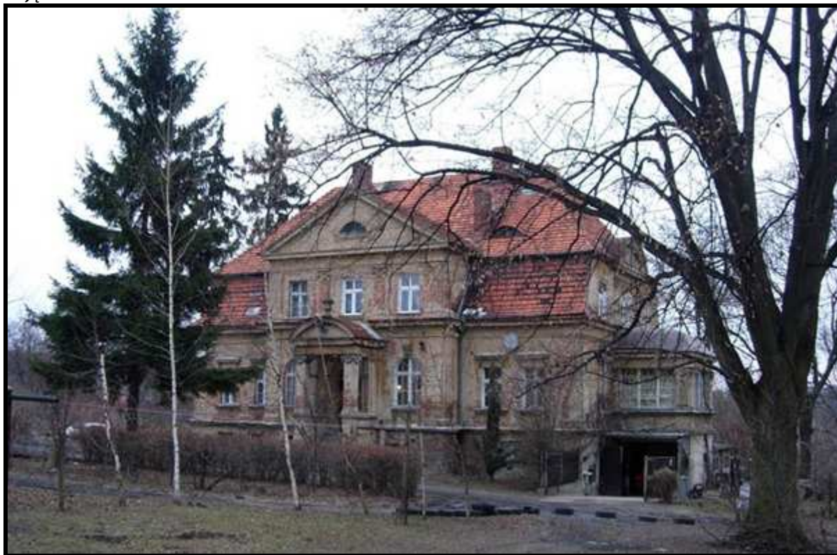
Zdjęcie 4 Pałac w Raszowie