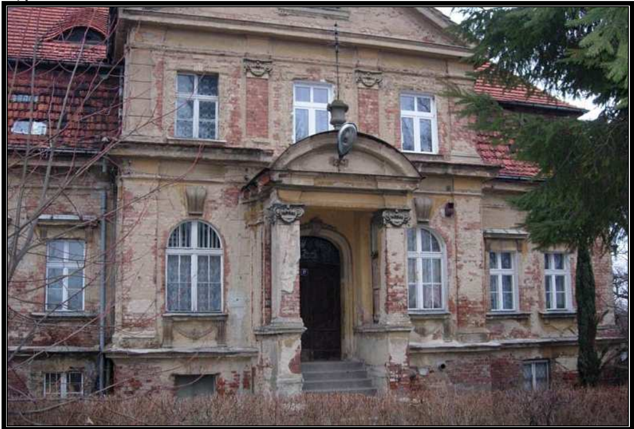
Zdjęcie 1 Pałac w Raszowie