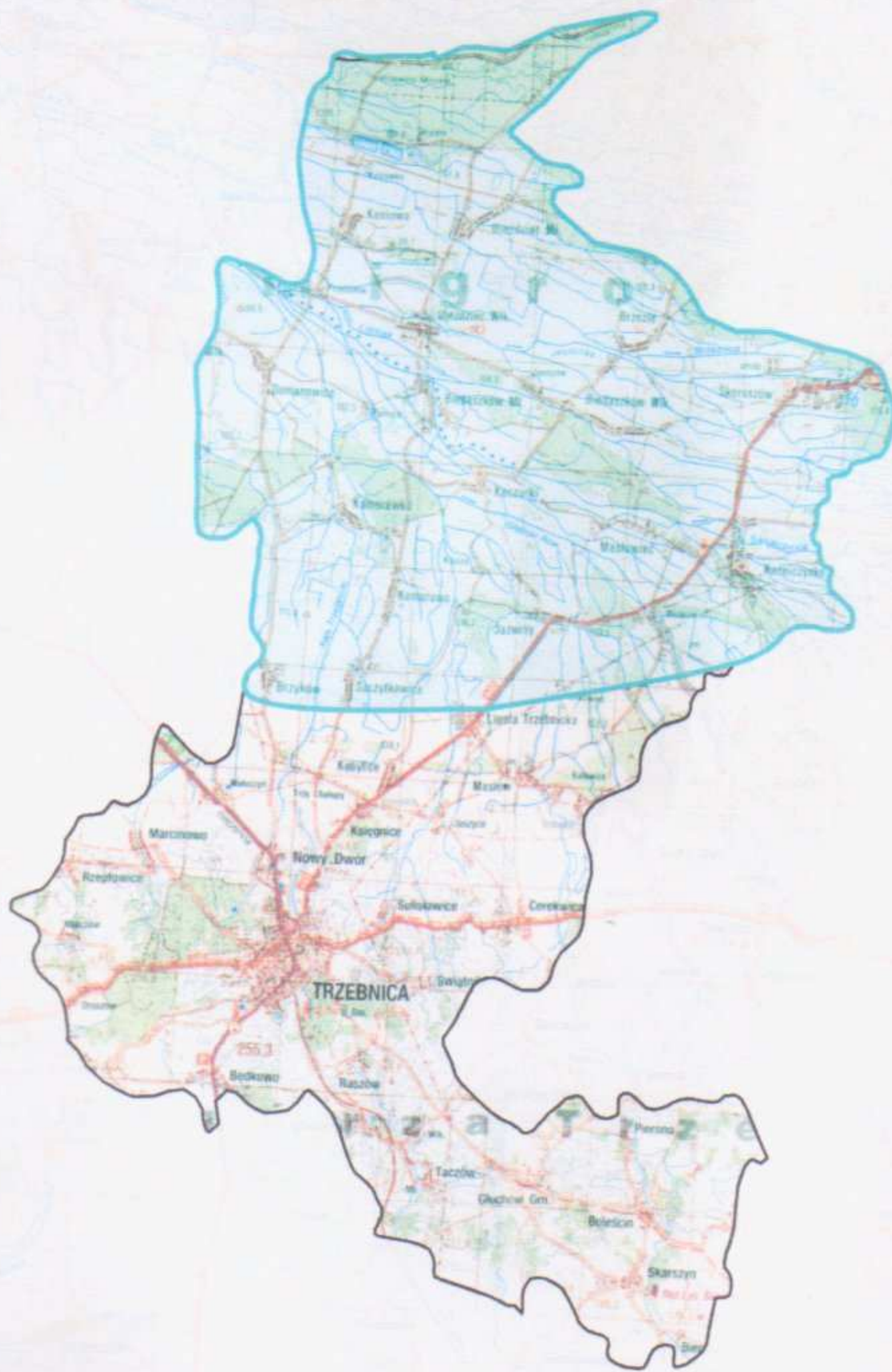
Zasięg głównego zbiornika wód podziemnych GZWP 303 Pradolina Barycz - Głogów