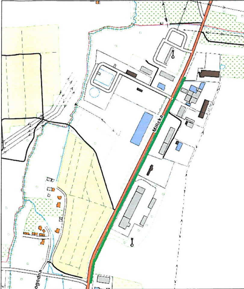
Rysunek 1 Obszar objęty inwentaryzacją drzew oznaczono kolorem zielonym.