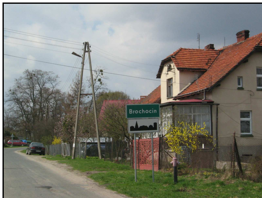
Fot.1. Wjazd do wsi Brochocin.