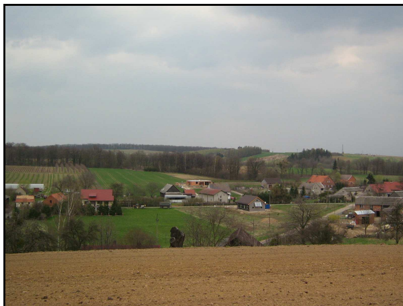
Fot.6. Panorama wsi.