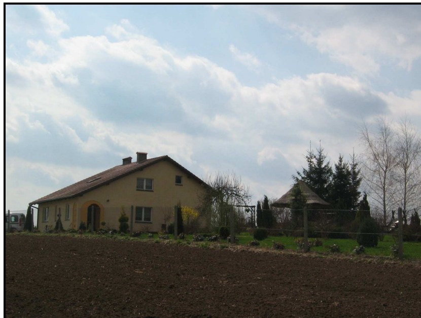
Fot.5. Nowa zabudowa mieszkaniowa.