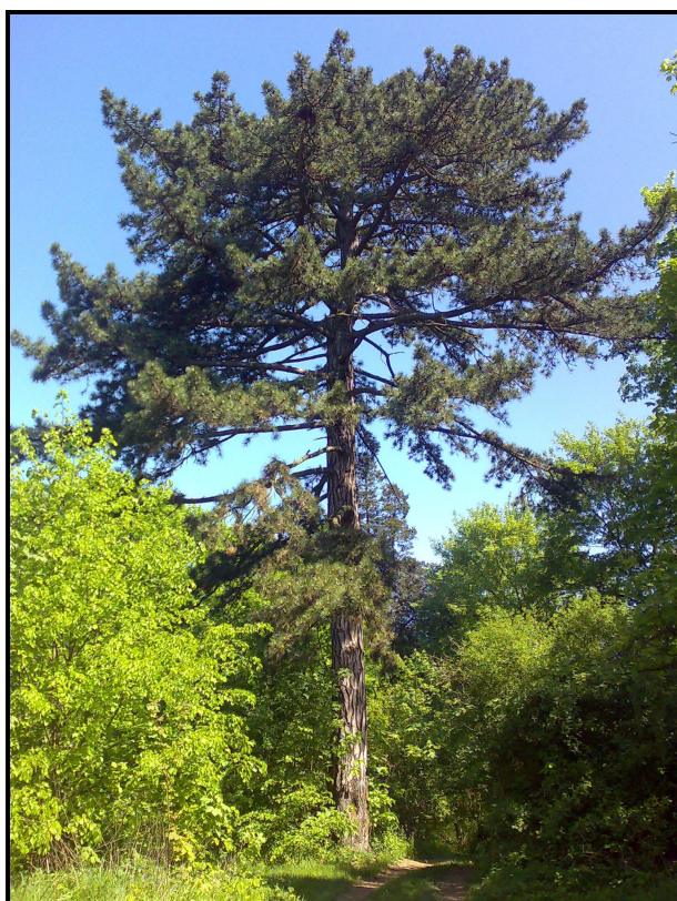
Fot.3. Sosna czarna-pomnik przyrody.