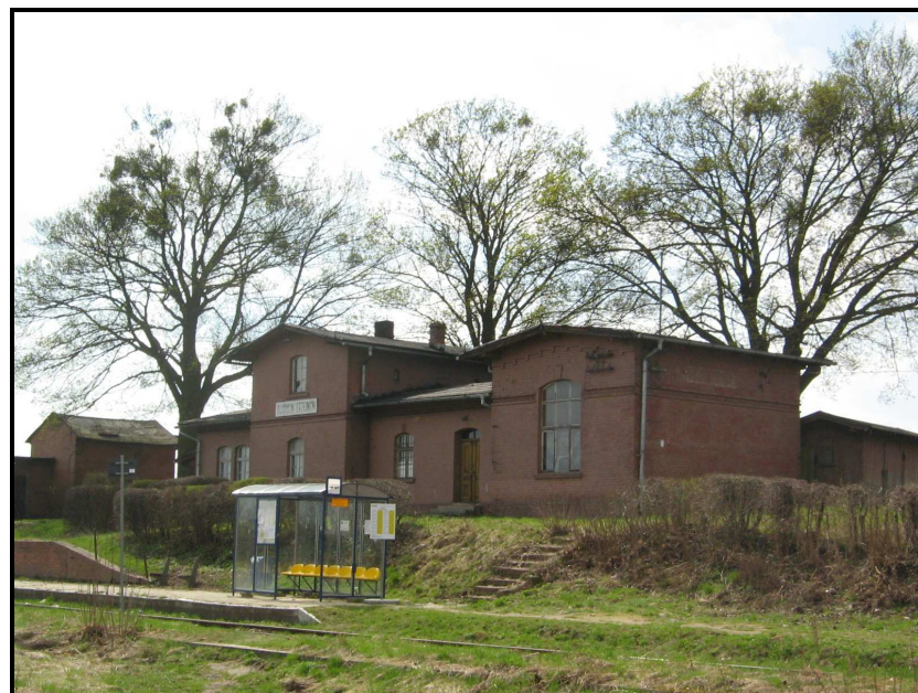
Fot.4. Stacja kolejowa.