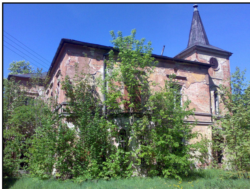
Fot.2. Zaniedbany pałac.