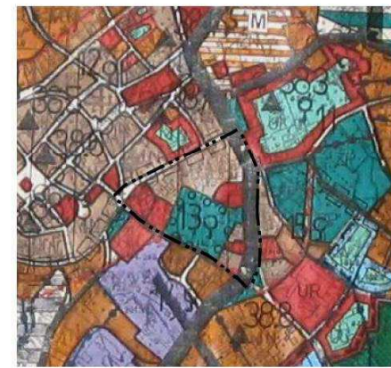
Studium uwarunkowań i kierunków zagospodarowania przestrzennego gminy Trzebnica - uchwała nr XXII/16/2000 Rady Gminy Trzebnica