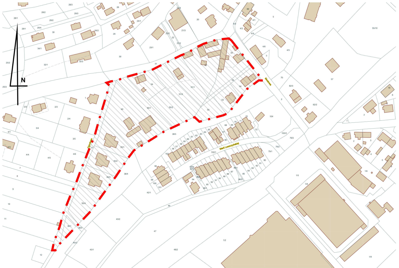
FRAGMENT ZAŁĄCZNIKA GRAFICZNEGO DO UCHWAŁY NR XI/107/07 RADY MIEJSKIEJ W TRZEBNICY Z DNIA 26.10.2007 ROKU