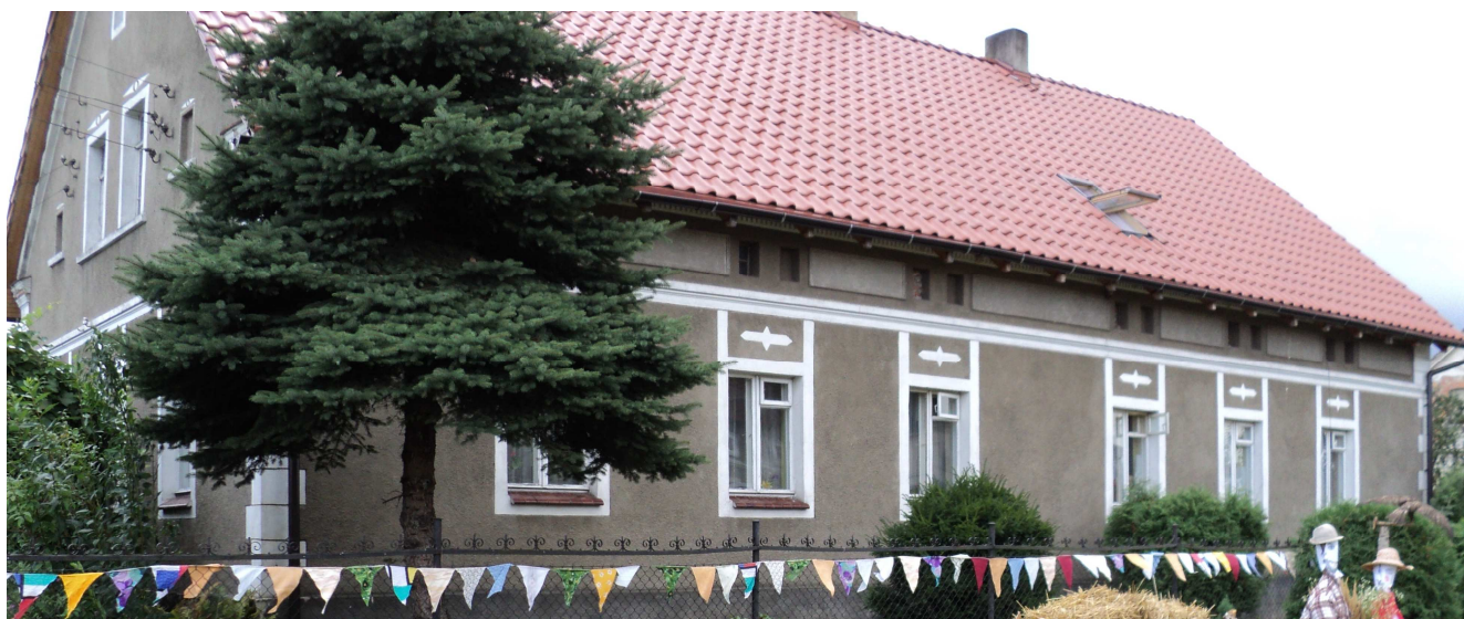
Charakterystyczna zabudowa z początku XX wieku