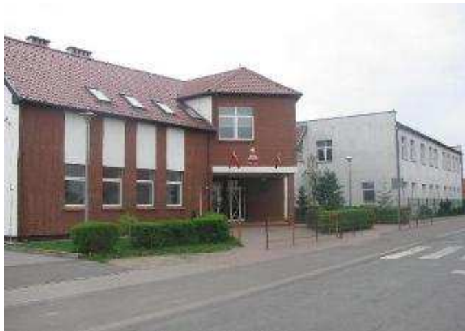
Szkoła Podstawowa i Gimnazjum