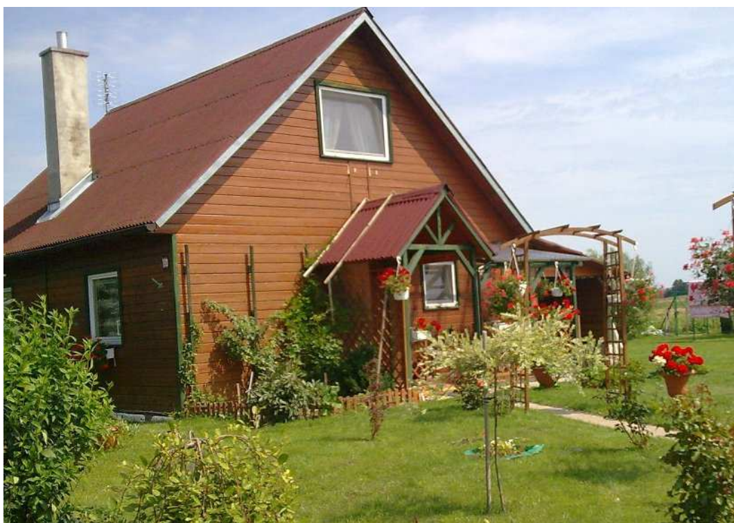
Ekologiczny dom szkieletowy - pierwszy drewniany dom we wsi