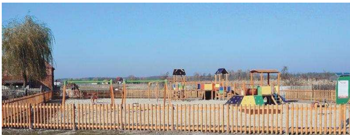
Rysunek 10 Plac zabaw w Ujeźdźcu Małym

Na terenie wsi został wybudowany plac zabaw w roku 2011. W skład jego wyposażenia wchodziły przyrządy do zabaw (huśtawki, drabinki, piaskownica, itp) dla najmłodszych mieszkańców miejscowości. Plac zabaw został zbudowany z dala od szosy, przez co poprawił on bezpieczeństwo najmłodszych mieszkańców Ujeźdźca Małego. Projekt budowy placów zabaw w gminie Trzebnica był realizowany w ramach zadania „Poprawa jakości życia na obszarach wiejskich Gminy Trzebnica poprzez budowę placów zabaw i boiska wielofunkcyjnego współfinansowana z Programu Rozwoju Obszarów Wiejskich 2007-2013”. Koszt projektu wyniósł 585 tysięcy zł. W najbliższym czasie w gminie Trzebnica powstanie kolejnych 20 takich placów zabaw, jak w Ujeźdźcu Małym.