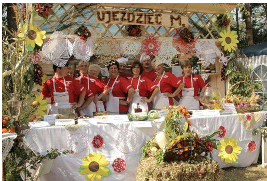
Rysunek 9 Stanowisko Ujeźdźca Małego na Dożynkach Gminnych

W Ujeźdźcu Małym nie odbywają się żadne inne ogólnogminne imprezy kulturalne. Mieszkańcy mają jednak szansę uczestnictwa w wielu wydarzeniach mających miejsce na terenie gminy. Jedną z imprez są Gminne Dożynki, na którą najbardziej zaangażowani mieszkańcy przygotowują winiec dożynkowy.