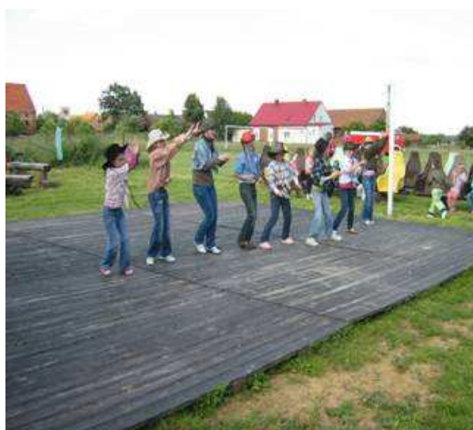
Rysunek 6 Dzień Dziecka w stylu kowbojskim (2009 r.)

Przykładem wysokiego poziomu zaangażowania Stowarzyszenie „Otwarte” Organizacja Działająca na Rzecz Wsi Ujeździec Mały w sprawy wsi jest wspólne i skoordynowane działanie w trakcie organizacji imprez okolicznościowych (Dzień Dziecka, Dożynki, spotkania opłatkowe, zabawy karnawałowe itp.) Imprezy te odbywają się najczęściej na boisku sportowym, pod gołym niebem, gdyż wieś nie posiada obiektu nadającego się do organizacji tego typu spotkań (świetlica wiejska posiada pomieszczenia do kapitalnego remontu, gdyż w aktualnym stanie nie nadaje się do wykorzystania).