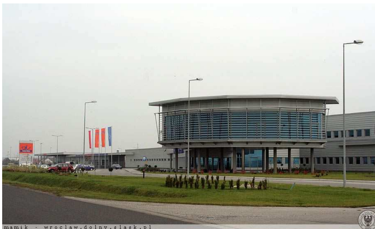
Rysunek 5 Część biurowa zakładów Tarczyński SA

Mieszkańcy Ujeźdźca Małego tworzą zorganizowaną społeczność. W ramach tworzenia lokalnego społeczeństwa obywatelskiego starają się tworzyć stowarzyszenia i organizacje, mające na celu wzmacnianie społecznego kapitału, który może zostać wykorzystany, jako element prorozwojowy i dążą do rozwoju miejscowości. Tym samym społeczność wiejska charakteryzuje się wysokim poziomem aktywności i dużym zaangażowaniem w sprawy wsi oraz gminy.