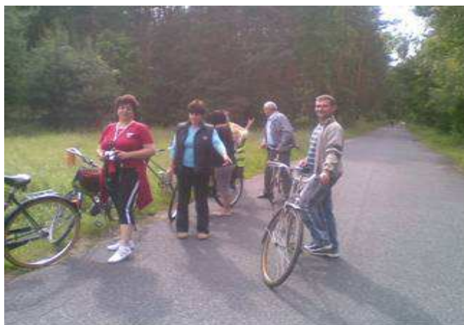
Rysunek 8 Członkowie Koła Turystyki Rowerowej na jednej z wycieczek

mieszkańców, propagującą cyklistykę w malowniczych terenach Wału Trzebnickiego i Doliny Baryczy.