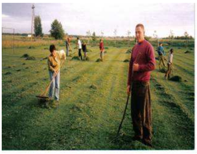
Rysunek 7 Wspólna praca mieszkańców przy wykaszaniu boiska sportowego

Inną organizacją funkcjonującą na terenie miejscowości jest klub piłki nożnej Sokół Ujeździec Mały, propagujący sport na terenie wiejskim. Klub charakteryzują biało-niebieskie barwy. Na boisku oprócz ligowych rozgrywek, miejsce mają imprezy typowo rekreacyjne dla mieszkańców wsi. Dzięki funkcjonowaniu klubu (obecnie na poziomie C-klasy) mieszkańcy mają możliwość aktywnego spędzenia czasu, poprzez uprawianie piłki nożnej. W Ujeźdźcu Małym prężnie działa również Koło Turystyki Rowerowej, otwarte na wszystkich