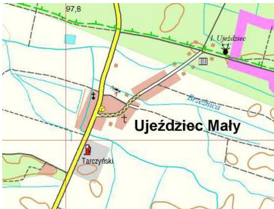
Rysunek 4 Ujeździec Mały

Miejscowość zajmują w głównej mierze tereny rolnicze przez co wpisuje się ona w wydzielony w ramach Strategii rozwoju obszarów wiejskich, region rolniczo-rekreacyjny. Ujeździec Mały, podobnie jak i pozostałe miejscowości gminy Trzebnica charakteryzuje się średnimi warunkami dla rozwoju produkcji rolniczej. Wskaźnik jakości rolniczej przestrzeni produkcyjnej określony został przez IUNG na poziomie 60 – 80 pkt. W bezpośredniej bliskości Ujeźdzca Małego występują lasy, co ma związek z przewagą słabych gleb na terenie miejscowości.