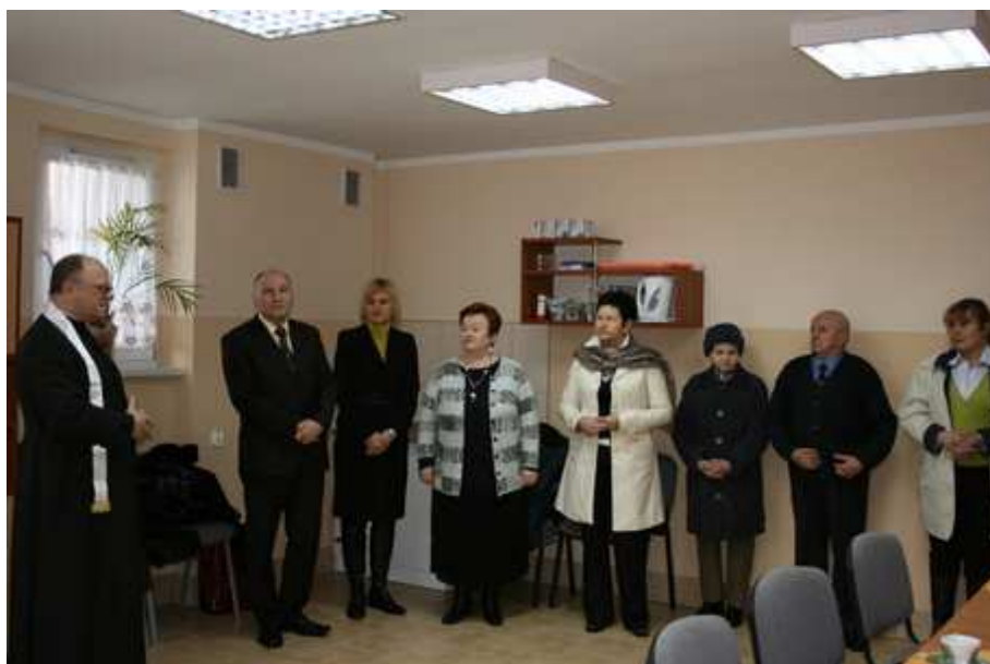
Rysunek 7 Otwarcie Świetlicy w Rzepotowicach