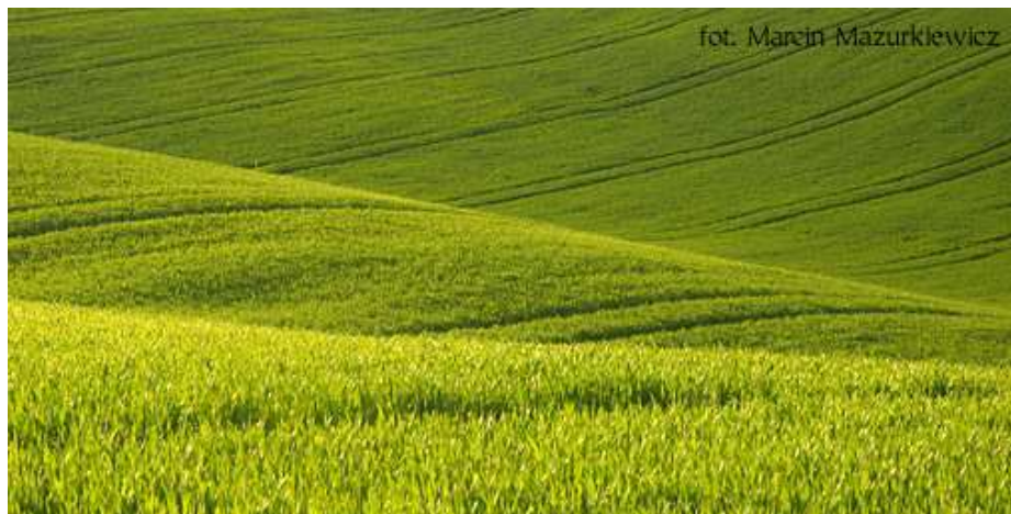
Rysunek 12 Pola przy Czerwonym Szlaku Kocich Gór

– Kuraszków – Kozie Czuby – Piekary – Przeclawice – Rzepotowice – Malczów – Farna Góra – Kapliczne Wzgórze - Trzebnica ) oraz 14-kilometrowa trasa rowerowo – piesza: Trzebnica – Marcinowo – Rzepotowice – Malczów – Żłota Polana – Dębowy Wierch – Ciemna Góra – Farny Uplaz – Farna Góra – Trzebnica).