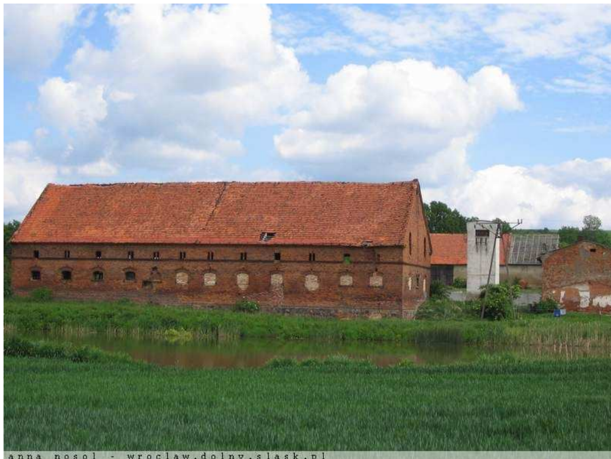
Rysunek 6 Zabudowania pofolwarczne w Rzepotowicach

podziału i sposobu zagospodarowania działek. Zmierza też do restauracji i modernizacji technicznej obiektów o wartościach kulturowych z dostosowaniem współczesnej funkcji do wartości obiektów. W Rzepotowicach strefa „B” występuje ze względu na pozostałości po folwarku, który wyraźnie odznacza się w układzie ruralistycznym miejscowości.