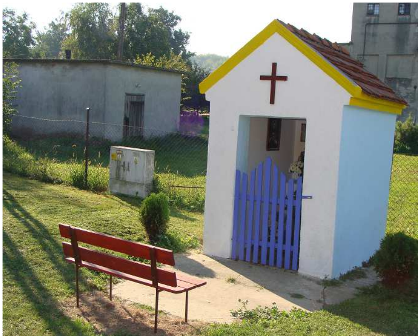
Rysunek 11 Kapliczka w Rzepotowicach

Kolejnym obiektem o charakterze sakralnym w Rzepotowicach jest kapliczka poświęcona Matce Bożej.