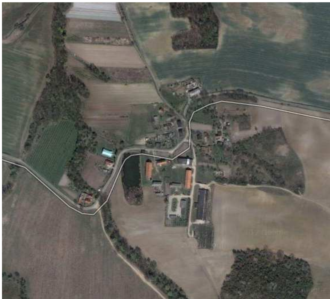
Rysunek 5 Rzepotowice na zdjęciu satelitarnym

Szatę roślinną Rzepotowic, poza niewielkimi skupiskami drzew urozmaicają łąki. Walory szaty roślinnej należy określić jako umiarkowane, a stan środowiska jest zadowalający. Rzeźba terenu jest pagórkowata, częściowo zalesiona. Przez wieś przebiega czerwony szlak przez Wzgórza Trzebnickie: Oborniki Śląskie - Masyw Grzybka - Dębowy Wąwóz - Kuraszków - Kozie Czuby - Piekary - Przecławie - Rzepotowice - Malczów - Farna Góra - Kapliczne Wzgórze - Trzebnica (22 km).