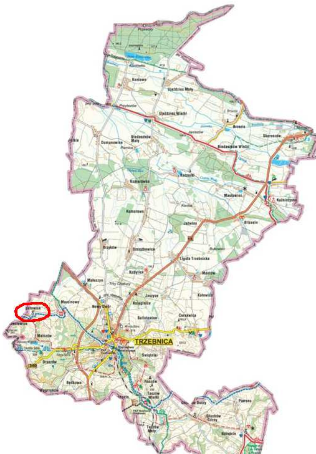
Rysunek 3 Lokalizacja Rzepotowic na mapie gminy Trzebnica