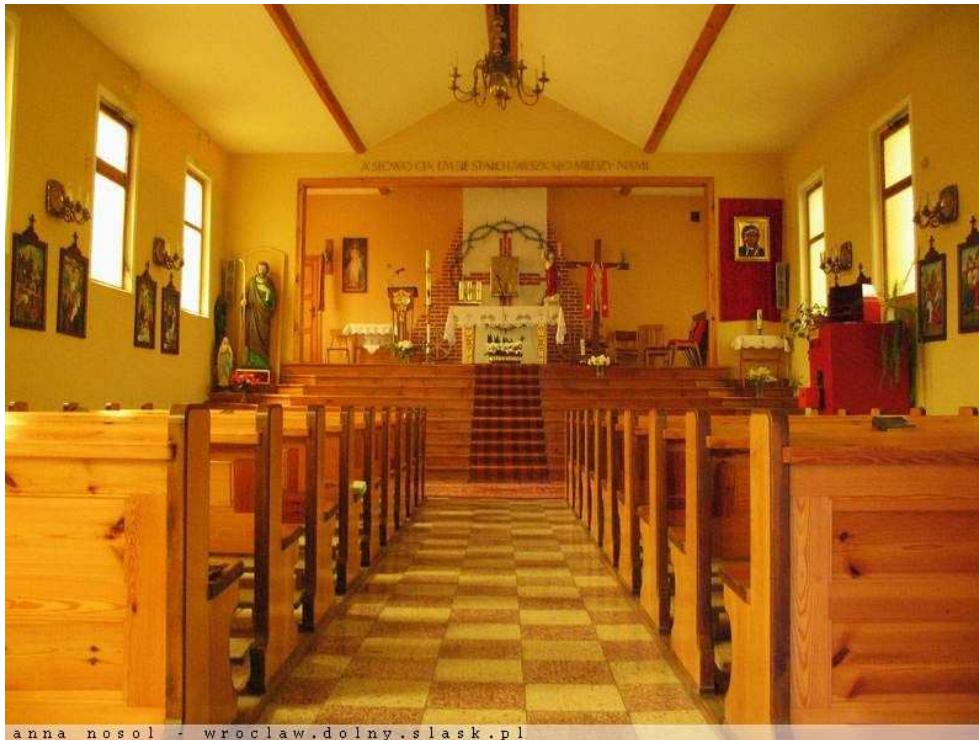
Rysunek 10 Wnętrze kościoła

Kolejnym obiektem o charakterze sakralnym w Rzepotowicach jest kapliczka poświęcona Matce Bożej.