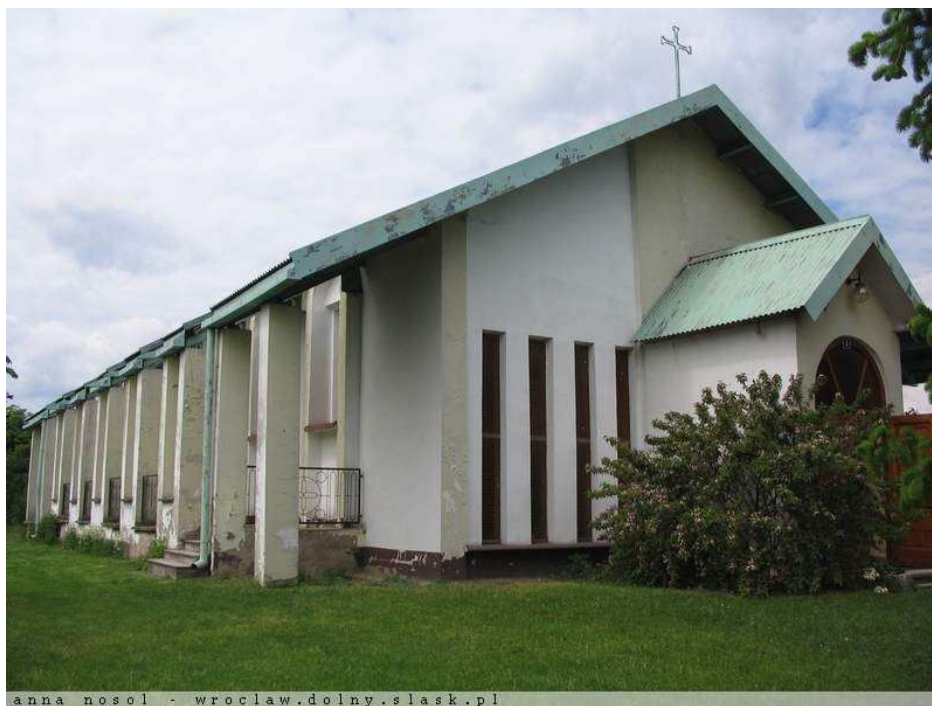
Rysunek 8 Kościół pw. Bożego Ciała przed renowacją

W ostatnich latach kościół przeszedł renowację. Ściany zewnętrzne zostały poddane czyszczeniu mechanicznemu i uzupełnianiu ubytków, a następnie pomalowane je na zielono, wymianie podległa również cała powierzchnia blach na dachu kościoła oraz przedsionka.