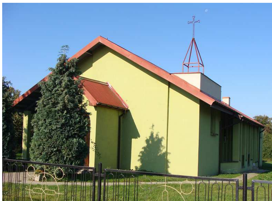
Rysunek 9 Kościół pw. Bożego Ciała po renowacji

W ostatnich latach kościół przeszedł renowację. Ściany zewnętrzne zostały poddane czyszczeniu mechanicznemu i uzupełnianiu ubytków, a następnie pomalowane je na zielono, wymianie podległa również cała powierzchnia blach na dachu kościoła oraz przedsionka.