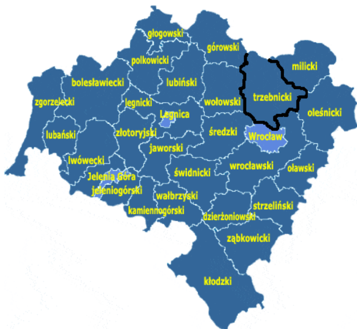
Rysunek 1 Lokalizacja powiatu trzebnickiego na mapie województwa dolnośląskiego

Gmina leży na terenie niejednorodnym morfologicznie. Północ gminy tworzy Kotlina Żmigrodzka, a południe – Wzgórza Trzebnickie.