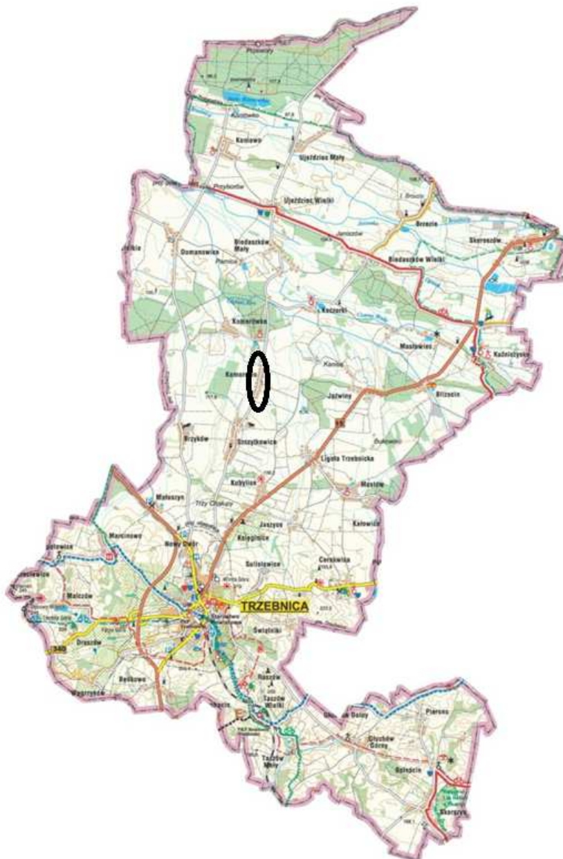
Rysunek 3 Lokalizacja Komorowa na mapie gminy Trzebnica

Wieś Komorowo leży w północnej części gminy Trzebnica. W sąsiedztwie wsi leżą takie miejscowości jak: Szczytkowice, Komorówko, Jażwiny czy Brzyków. Komorowo jest oddalony od Trzebnicy o ok. 8 km, od Wrocławia o ok. 45 km i ok. 30 km od Milicza.