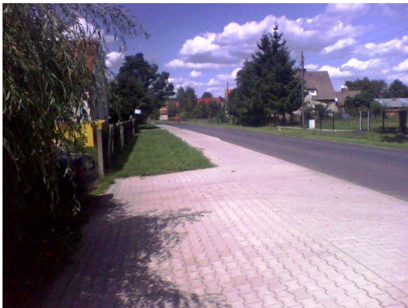
Rysunek 5 Wyremontowana droga powiatowa wraz z chodnikiem przebiegająca wzdłuż miejscowości