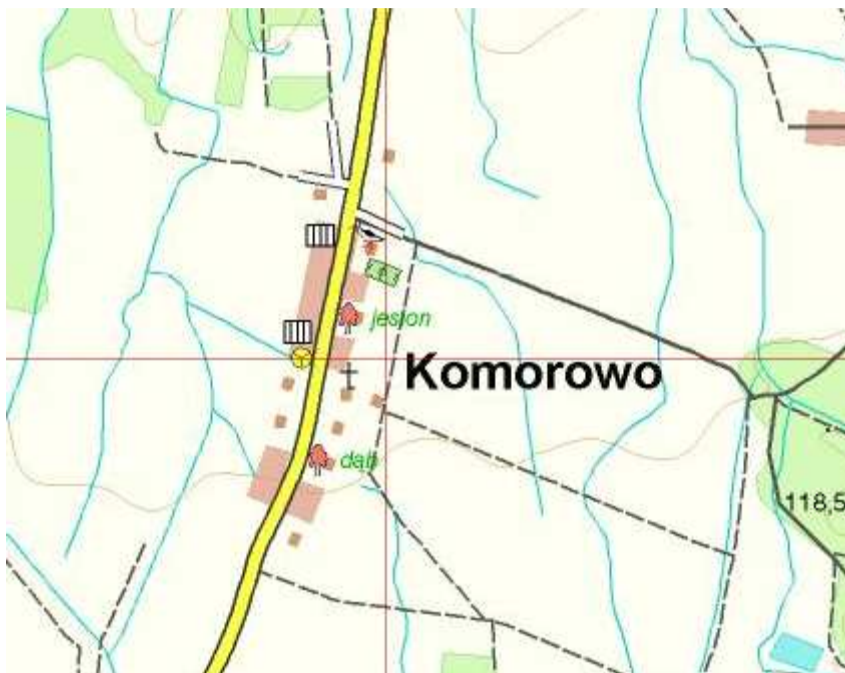
Rysunek 4 Komorowo