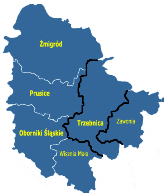
Rysunek 2 Lokalizacja gminy Trzebnica w powiecie trzebnickim

Pod względem strukturalno-funkcyjnym, według Planu Zagospodarowania Przestrzennego Województwa Dolnośląskiego (2000 r.), gmina w całości wchodzi w skład strefy obszarów rolno-leśnych o podwyższonych standardach ochrony środowiska i dominujących funkcjach ochronnych oraz turystyczno-rekreacyjnych na terenach nizinnych. Wiodącymi funkcjami gminy są funkcja rolnicza i turystyczno-uzdrowiskowa.