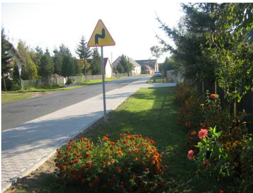
Rysunek 6 Wyremontowana droga powiatowa wraz z chodnikiem przebiegająca wzdłuż miejscowości