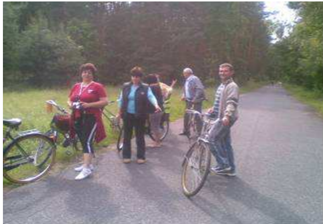
Rysunek 8 Członkowie Koła Turystyki Rowerowej na jednej z wycieczek

nożnej. W Ujeźdźcu Małym prężnie działa również Koło Turystyki Rowerowej, otwarte na wszystkich mieszkańców, propagujące cyklistykę w malowniczych terenach Wału Trzebnickiego i Doliny Baryczy.