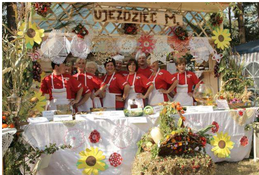
Rysunek 9 Stanowisko Ujeźdźca Małego na Dożynkach Gminnych

W Ujeźdźcu Małym nie odbywają się żadne inne ogólnogminne imprezy kulturalne. Mieszkańcy mają jednak szansę uczestnictwa w wielu wydarzeniach mających miejsce na terenie gminy. Jedną z imprez są Gminne Dożynki, na którą najbardziej zaangażowani mieszkańcy przygotowują winiec dożynkowy.