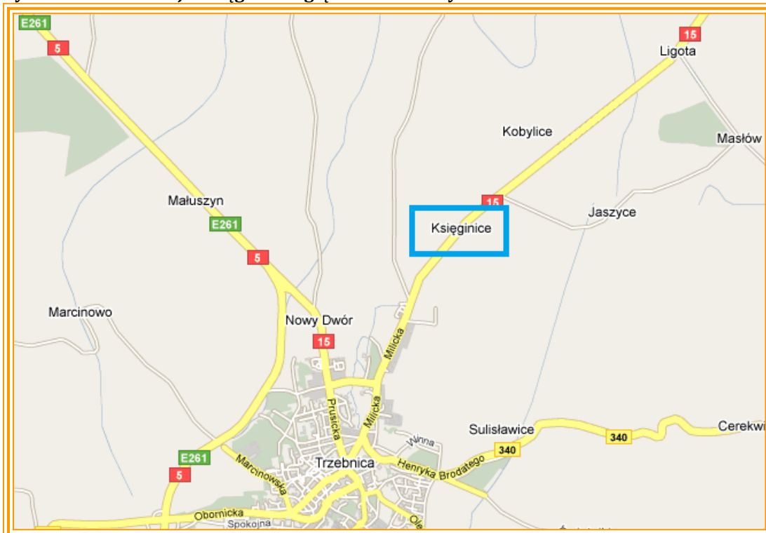
Rysunek 2 Lokalizacja Księginic względem Trzebnicy