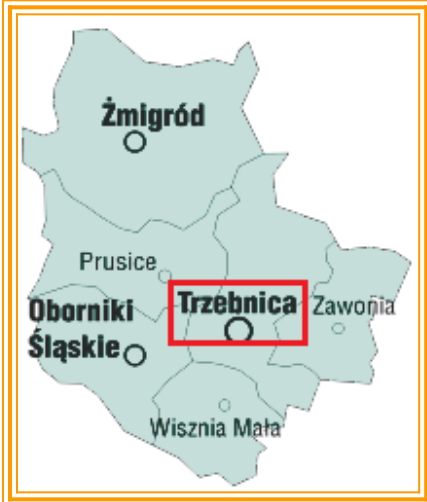
Rysunek 1 Mapa powiatu trzebnickiego

Niniejsze opracowanie stanowi plan odnowy miejscowości Księginice, położonej nieopodal Trzebnicy, w gminie Trzebnica i powiecie trzebnickim.