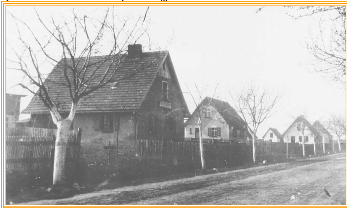
Rysunek 4 Dawna zabudowa wiejska w Księginicach