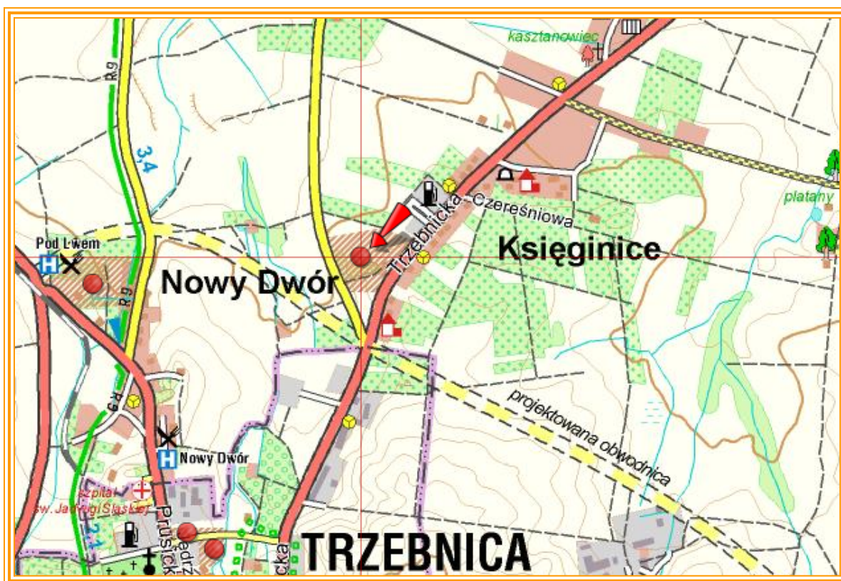
Rysunek 5 Tereny inwestycyjne na obszarze Księginic