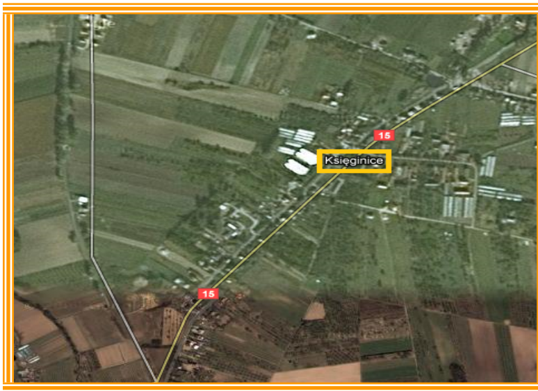
Rysunek 3 Układ przestrzenny miejscowości Księginice

Schematycznie układ miejscowości Księginice przedstawiono za pomocą poniższej mapki.