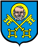
Studium Uwarunkowań i Kierunków Zagospodarowania Przestrzennego Gminy Trzebnica