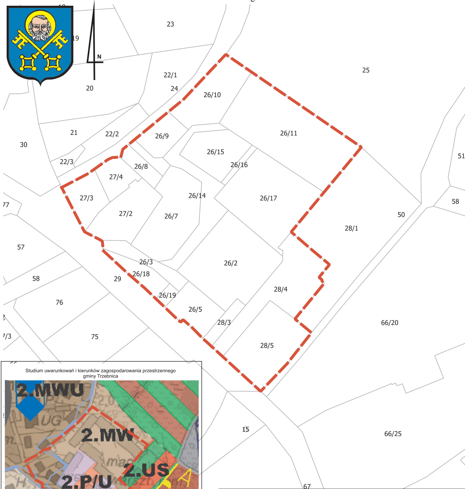
Studium uwarunkowań i kierunków zagospodarowania przestrzennego gminy Trzebnica