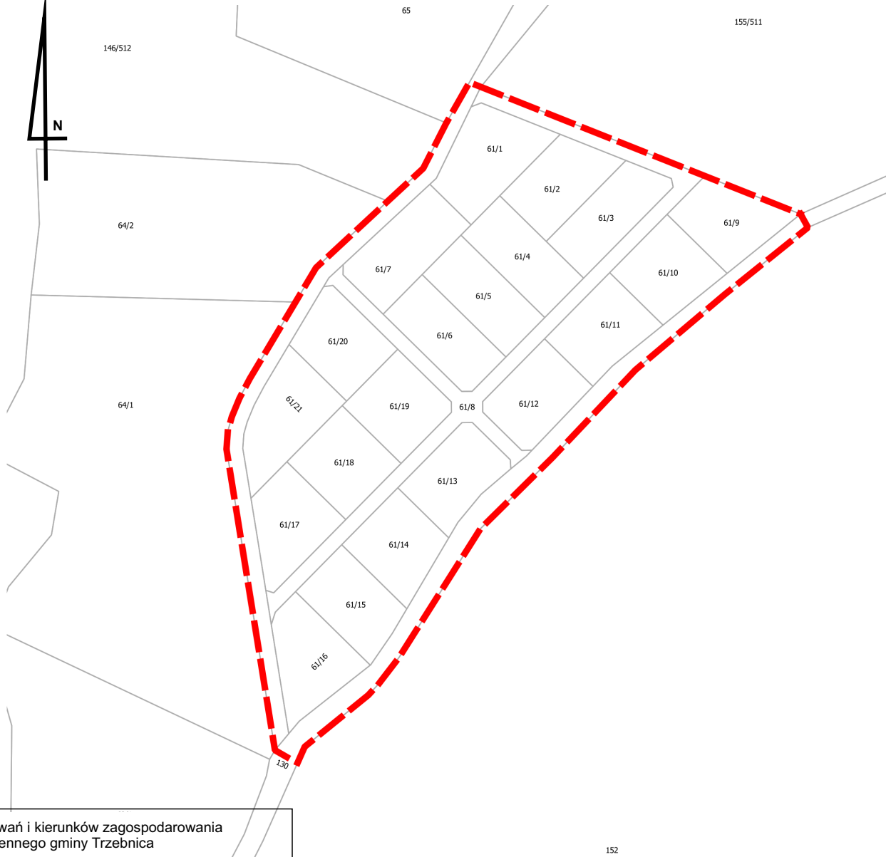
Studium uwarunkowań i kierunków zagospodarowania przestrzennego gminy Trzebnica