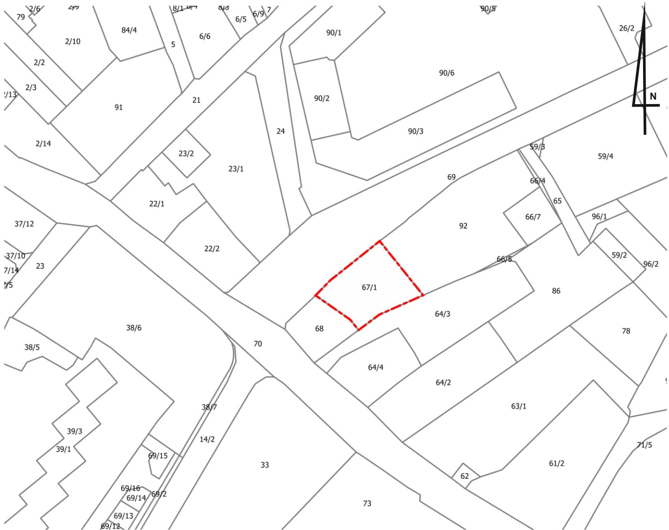
MIEJSCOWY PLAN ZAGOSPODAROWANIA PRZESTRZENNEGO OBSZARU WYZNACZONEGO ULICAMI: ŚW. JADWIGI, KS. DZ. W. BOCHENKA I OBRÓNCÓW POKOJU W TRZEBNICY