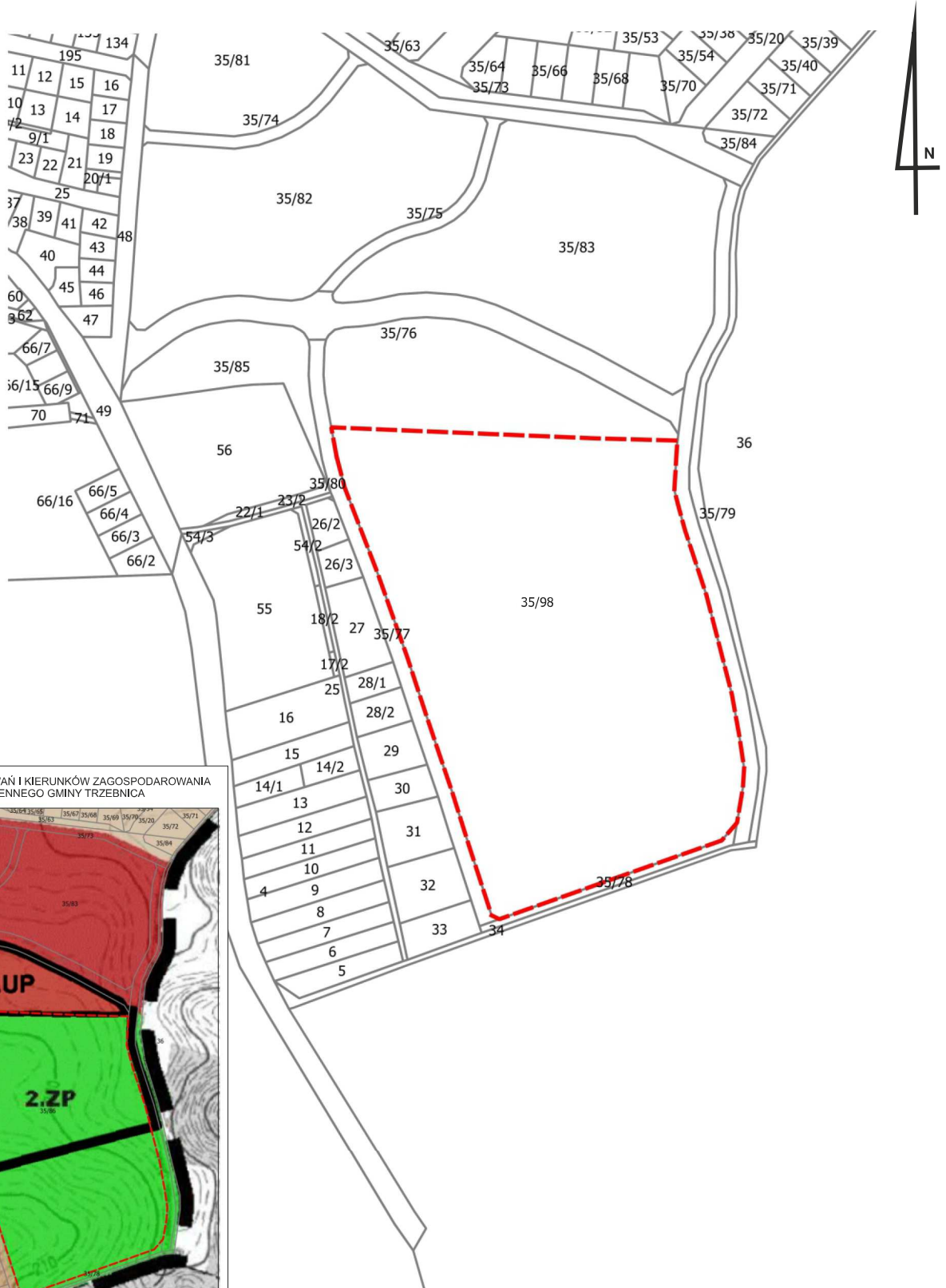
STUDIUM UWARUNKOWAŃ I KIERUNKÓW ZAGOSPODAROWANIA PRZESTRZENNEGO GMINY TRZEBNICA